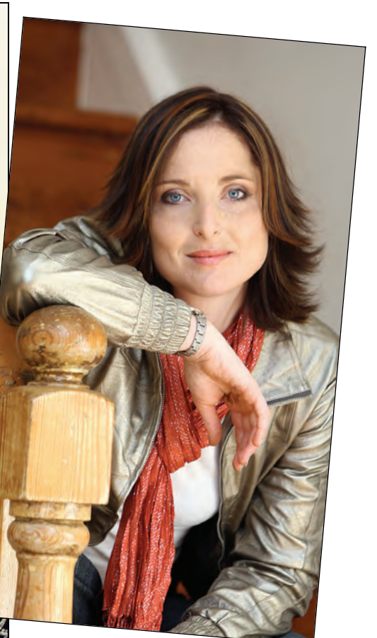
Ferguson ná haar oormoaksessie.

Vir motor-, huisinhoud- en besigheidsversekering, skakel ons DIREK.